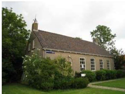
Arumerweg 38, Witmarsum