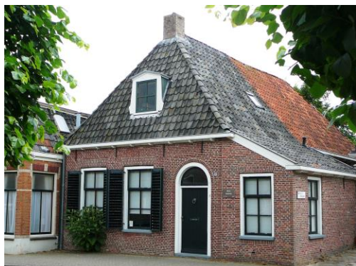
Grote Buorren 28, Pingjum

Bij een bezoek aan de vermaningen wordt o.a. verteld over Menno Simons en de achtergronden van Doopsgezinden.